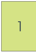
Moduł 1 pełna strona