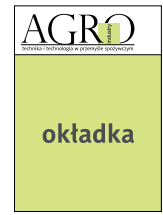
Moduł 1 str. okładki